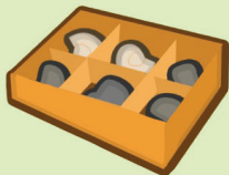
Fossilenset (met 6 fossielen)