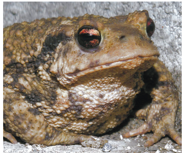
Links een bruine kikker, rechts een gewone pad